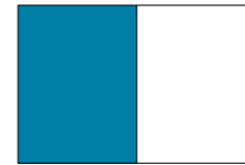
1/1-Seite: 210 x 280 mm