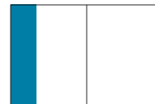
1/3-Seite (hoch): 70 x 280 mm